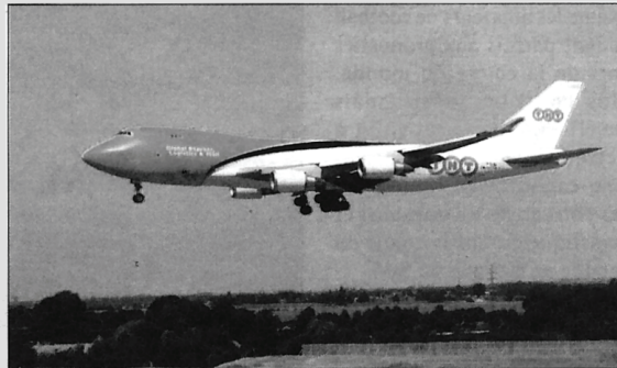
Le 747 de TNT est un visiteur régulier de Liege Airport.

2004 a vu l'inauguration du poste d'inspection vétérinaire frontalier Fly'in Farm, de même que les débuts du chantier du nouveau terminal pour les passagers, qui a été inauguré en 2005. L'année suivante ont commencé les travaux de construction d'un hall de traitement de fret